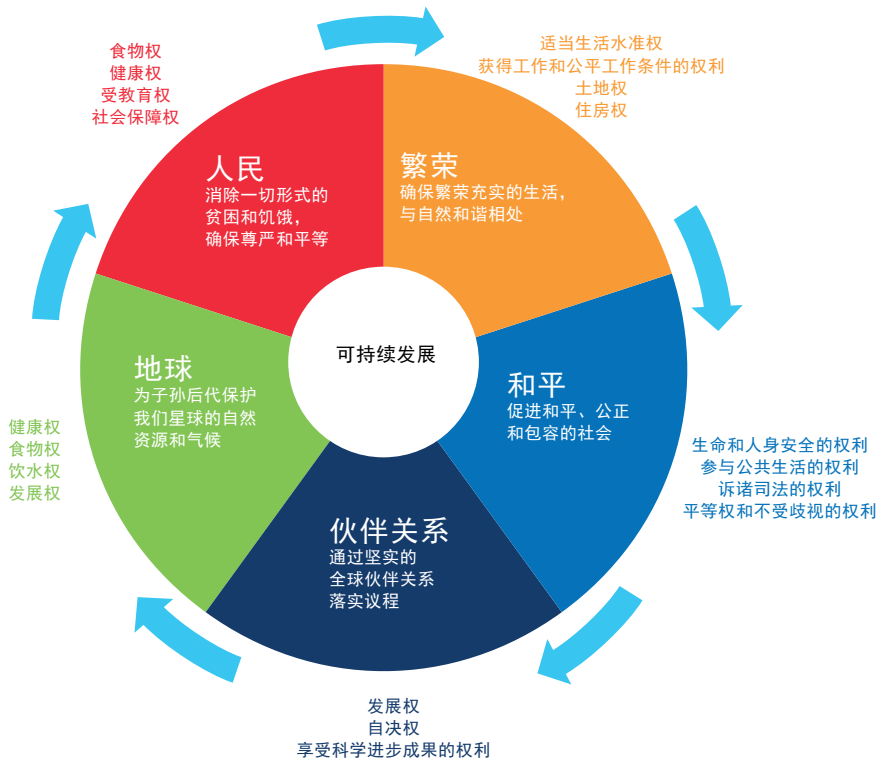
可持续发展与人权(图1)

“2019年3月7日，联合国常务副秘书长阿明娜·穆罕默德在人权理事会第40届会议上发言时表示，‘人权是《2030年议程》的核心，可持续发展是实现所有人权的一个有力工具’。人权为加强国家在实现可持续发展目标的方面的问责提供了有效途径。虽然《2030年议程》不是一项具有法律约束力的文书，但国际人权条约和国内法具有约束力。若从现有人权文书的角度分析可持续发展目标，那么可持续发展目标的许多具体目标便从目标或愿望转变为直接的权利。