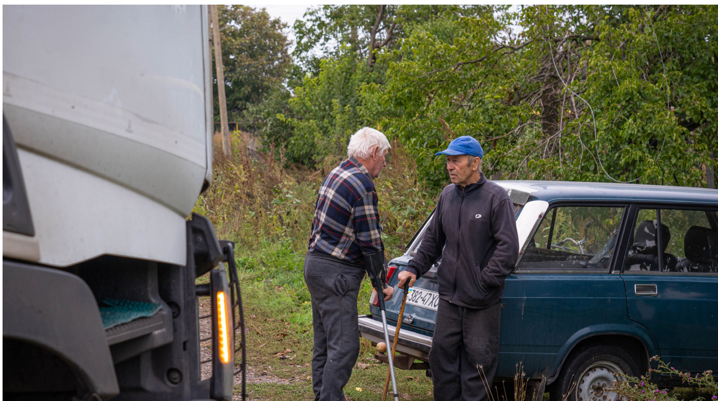
Двое пожилых мужчин из села Высокополье Херсонской области, которое до сентября 2022 года находилось под контролем Вооруженных сил Российской Федерации.

решения. Лица из данной последней группы, не имеющие родственников в Украине, которые могли бы поехать за ними в Российскую Федерацию, фактически не могут покинуть Российскую Федерацию. В некоторых случаях российские власти навязывали гражданство лицам, депортированным или перемещенным из учреждений, обеспечивающих долгосрочный уход в Украине в учреждения, обеспечивающие долгосрочный уход в Российской Федерации. Международное гуманитарное право запрещает принудительные перемещения и депортации, и допускает только эвакуацию при четко обозначенных обстоятельствах, что требует от оккупирующей Державы