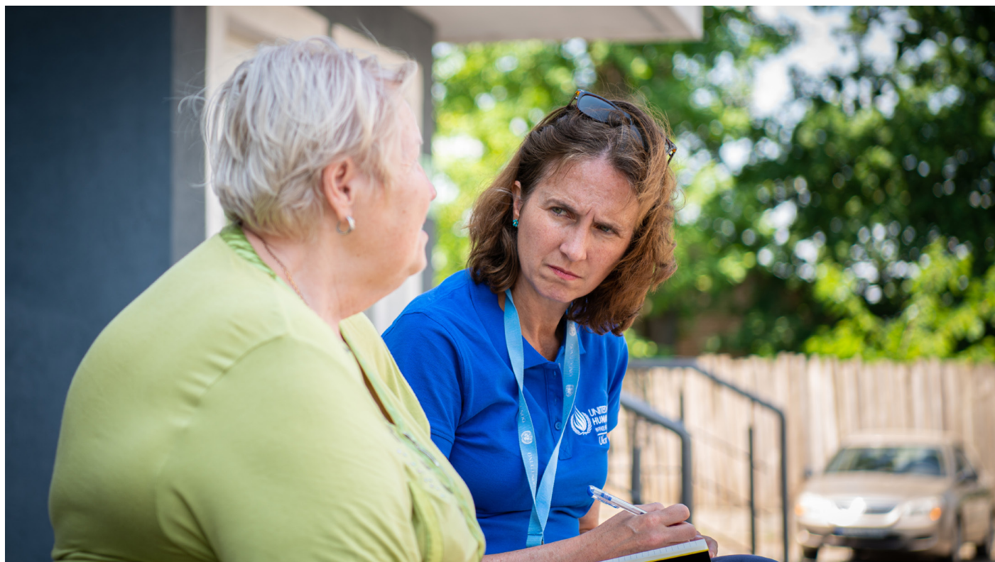
Сотрудница ММПЧУ проводит интервью с женщиной в Ирпене Киевской области, где в феврале и марте 2022 года Вооруженные силы Российской Федерации совершили множество нарушений прав человека.

Более того, указом также предусмотрено, что все жители, не имеющие российских паспортов, независимо от регистрации места жительства, должны выполнить различные административные процедуры и требования к учету, чтобы продолжать проживать и работать на оккупированной территории. Например, все юридические и физические лица, имеющие наемных работников, должны информировать российские власти об любом работнике, не имеющем российского паспорта, что может носить дискриминационный характер. В комплексе такие меры оказывают фактическое давление на граждан