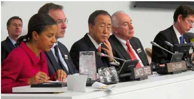
2010年12月10日，联合国秘书长潘基文在纽约联合国总部参加女同性恋者、男同性恋者、双性恋者和变性人平等问题的讨论。

不过，不歧视原则仍然是一个贯穿各领域的问题，国家须承担紧迫的义务。简而言之，人们不应基于性取向或性别认同而在享受权利方面受到歧视。正如高级专员曾经说过的那样，“普遍性原则即没有例外。人权毫无疑问是全体人类与生俱来的权利”。 3