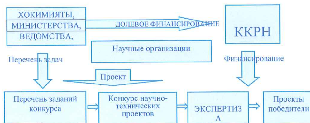
Рис. 1. Организация конкурса инновационных научно-технических проектов

На решение проблем, вошедших в перечень Государственного заказа объявляется конкурс научно-технических проектов, участие в котором могут принимать любые научно-исследовательские институты, проектные, конструкторско-технологические организации и учреждения, научно-производственные (технические) центры, фонды и др., независимо от их ведомственного подчинения и форм собственности.