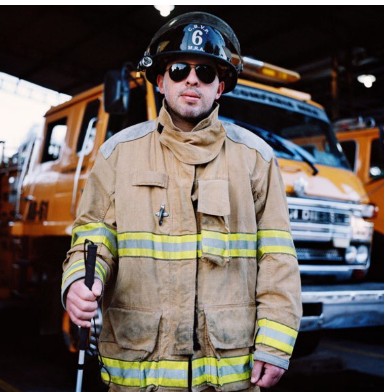
dans le cadre du projet européen « Bridging the Gap II – Inclusive Policies and Services for Equal Rights of Persons with Disabilities » .