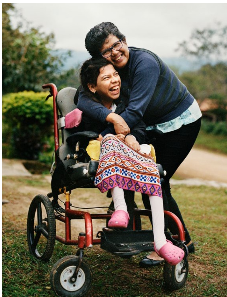
Photo de Christian Tasso, courtoisie de la Fundación Internacional y para Iberoamérica de Administración y Políticas Públicas (FIIAPP), dans le cadre du projet européen « Bridging the Gap II – Inclusive Policies and Services for Equal Rights of Persons with Disabilities ».