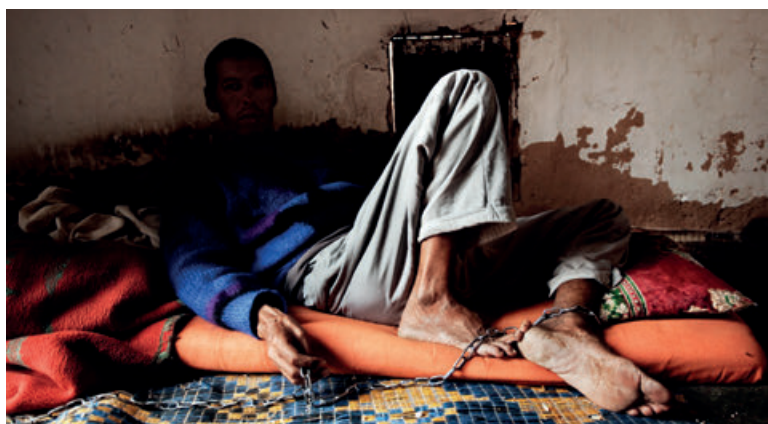
Фото: Кристиан Тассо, из проекта «Сахарцы».