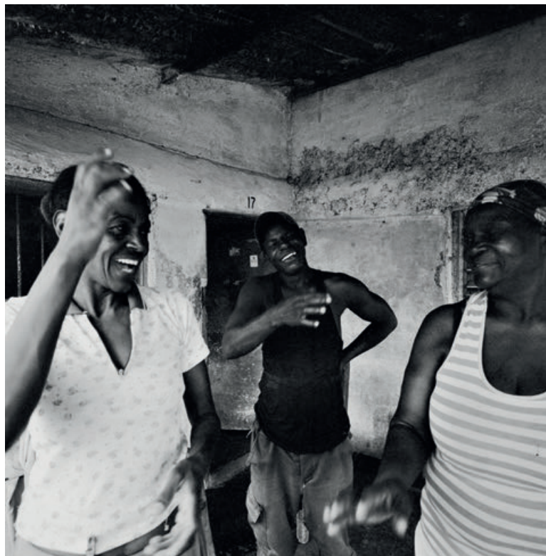
Фото: Кристиан Тассо, из проекта «15 процентов».