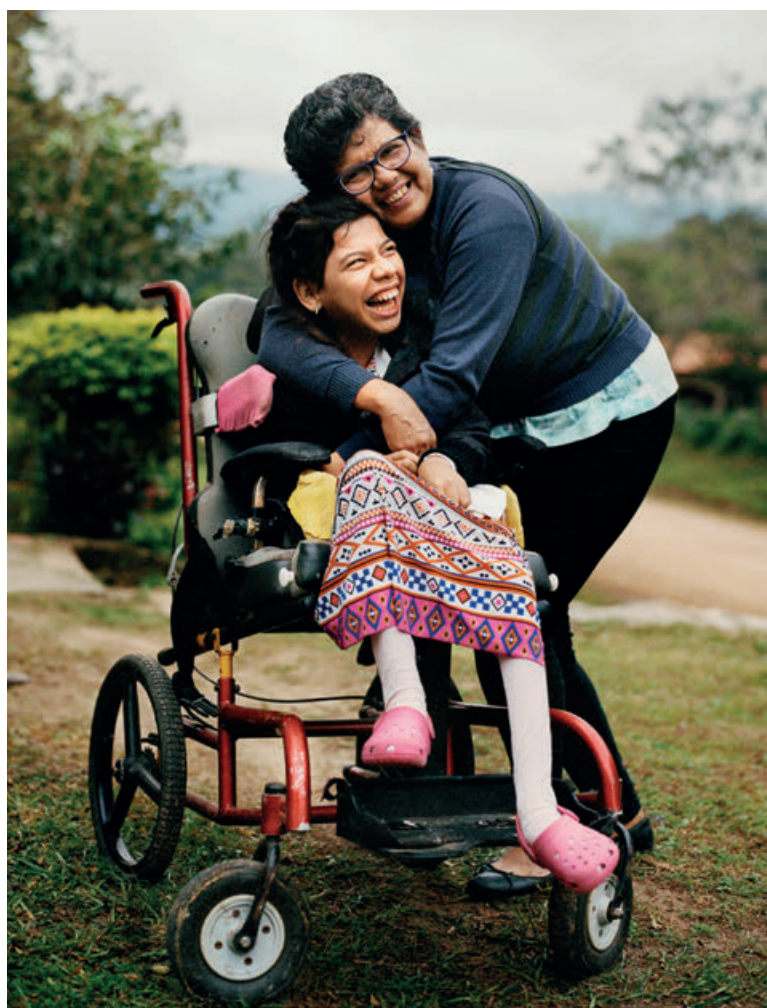
Фото: Кристиан Тассо. Сделано в рамках проекта Европейского союза «Сокращая дистанцию II – инклюзивная политика и услуги для равных прав людей с инвалидностью» и предоставлено Международным и Иbero-Американским обществом управления и государственной политики.