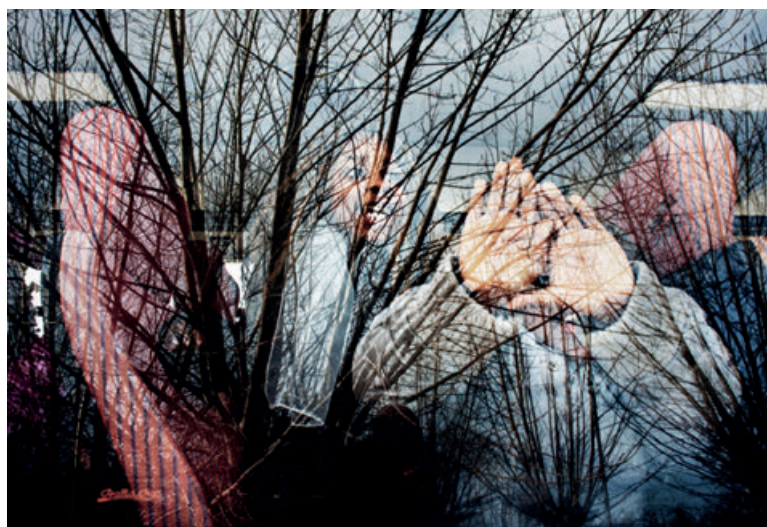
Фото: Кристиан Тассо, из проекта «Сахарцы».