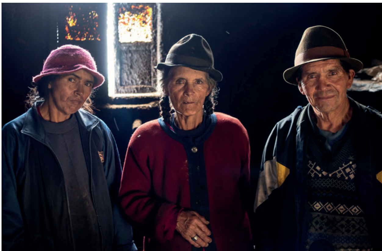
Фото: Кристиан Тассо, из проекта «15 процентов».