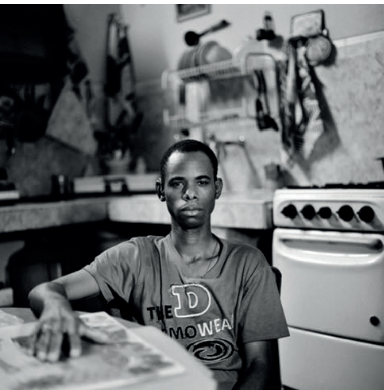
Фото: Кристиан Тассо, из проекта «15 процентов»