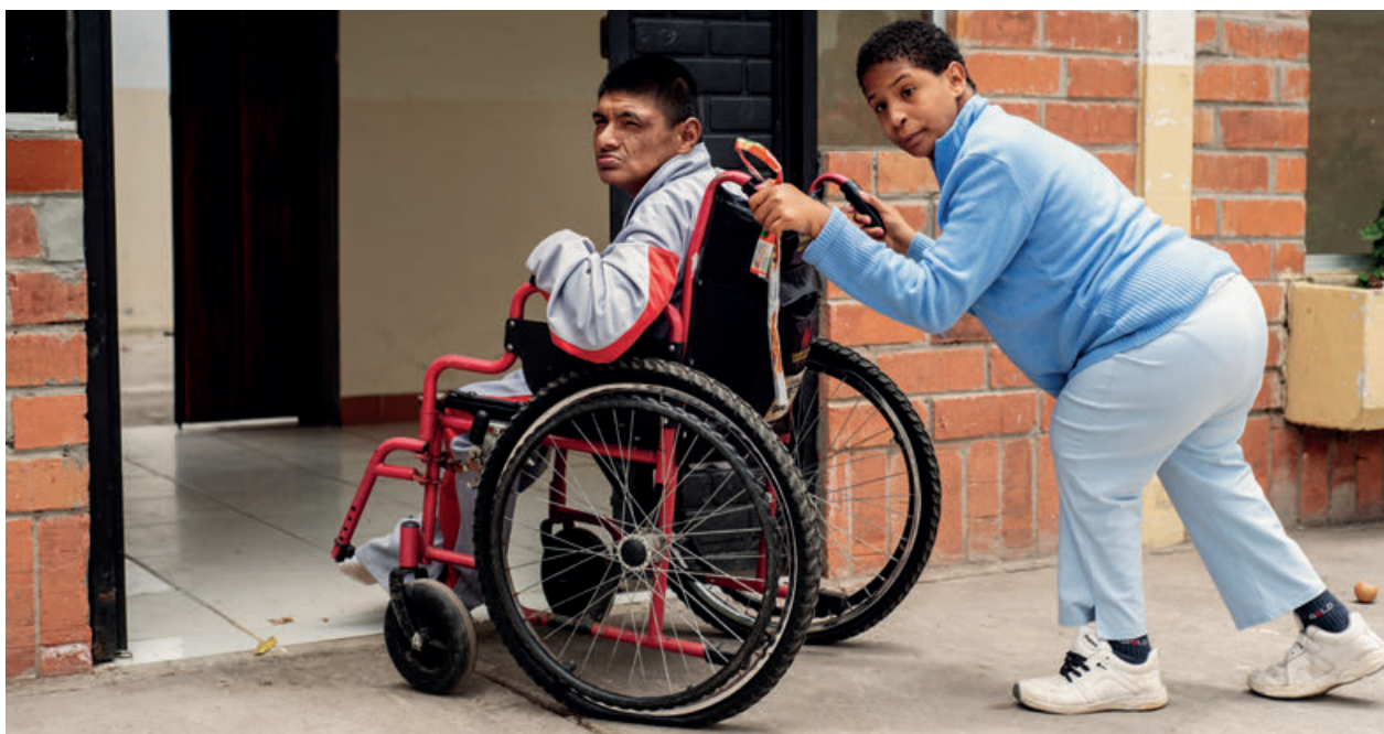
Фото: Кристиан Тассо, из проекта «15 процентов».