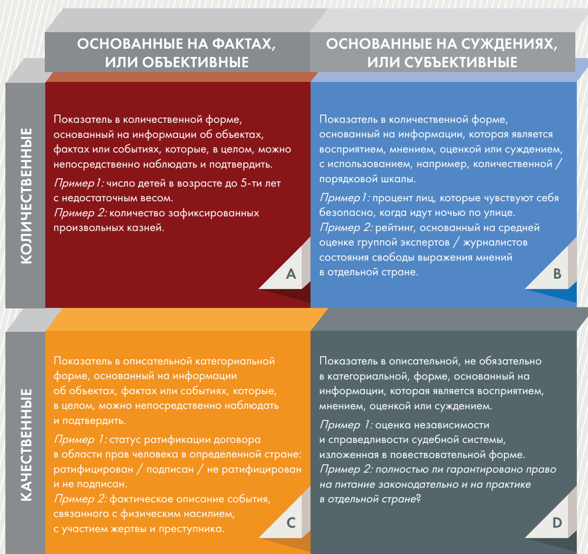
Рисунок IV Категории показателей в области прав человека

преодолеть определенную предвзятость в получении информации и ее интерпретации в отличие от других нечисловых и основанных на суждениях показателей. Поэтому целесообразно использовать основанные на фактах и количественные показатели и данные в той мере, в какой они повышают эффективность оценки в области прав человека.