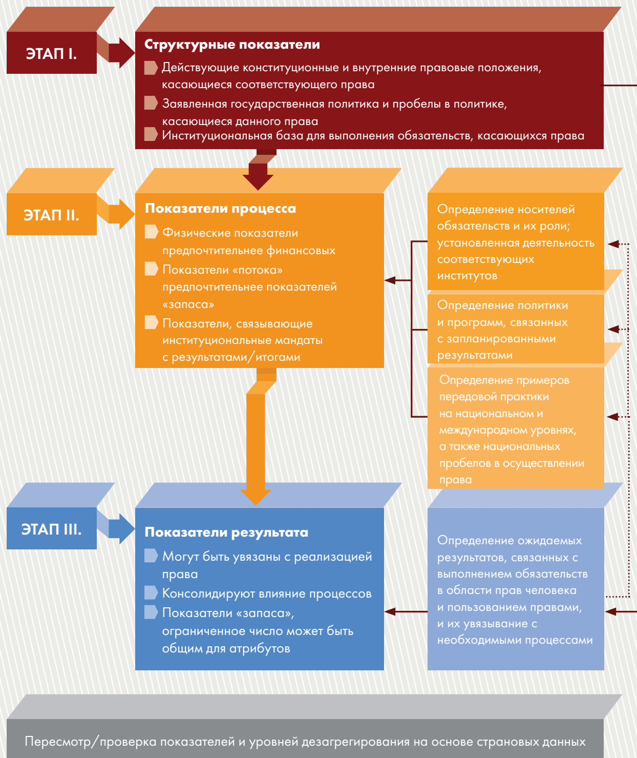
Рисунок IX Этапы выбора показателей