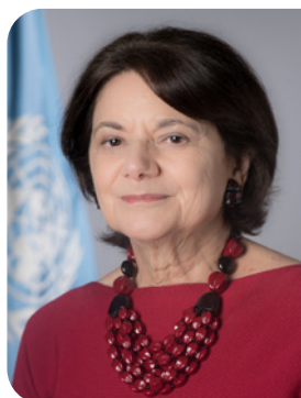
Rosemary A. DiCarlo Secrétaire générale adjointe aux affaires politiques et à la consolidation de la paix

Cet effort commun met en lumière le pouvoir et le potentiel du dialogue et des droits, et démontre que le succès du rétablissement de la paix passe par les droits fondamentaux de toutes les parties concernées, y compris les plus marginalisées. En intégrant le processus de médiation aux considérations relatives aux droits de l'homme, nous espérons et entendons augmenter les chances de parvenir à des accords de paix plus inclusifs et plus justes qui, à leur tour, favoriseront une paix plus durable.