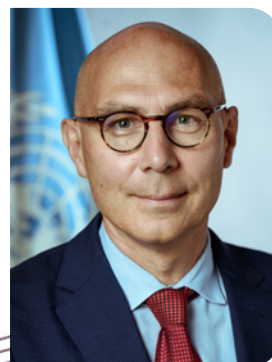
Volker Türk Haut Commissaire aux droits de l'homme